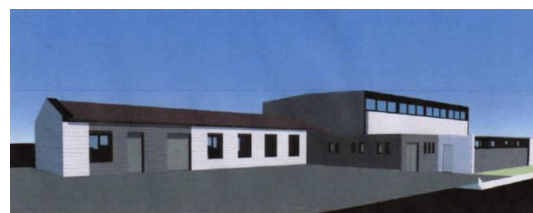
Vue du parking

A ce jour, les études sont terminées ; les demandes de subventions (Etat, Région, Département, CODAH) sont validées - en attente de réponse ou en cours de validation pour la Région. La consultation des entreprises va être lancée et les travaux sont prévus pour le 2ème trimestre 2018.