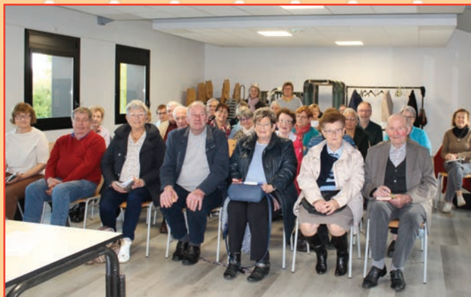
Conférence sérénité au volant