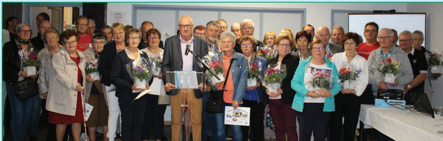
Les participants aux jardins fleuris