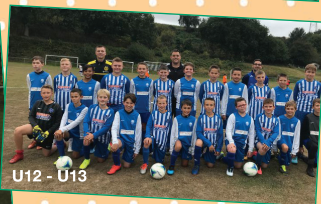
U12 - U13