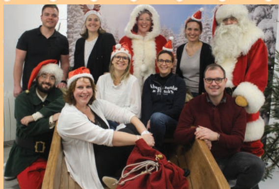
Parents d'élèves avec le Père et la Mère Noël

Dans les projets, nous avons également lancé la création d'une association. Ceci permettra aux parents qui ne souhaitent pas s'engager en tant que représentants élus mais qui ont tout de même envie de participer à l'organisation et à la tenue des diverses manifestations de nous rejoindre, ainsi que les grands parents et tout bénévole animé par l'envie de faire plaisir aux enfants ! A bientôt !