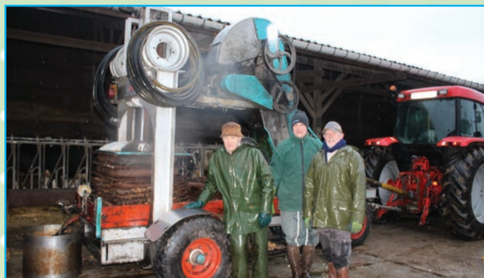
Pressée de pommes offerte par ETA FRIBOULET de Saint Sauveur d'Emalleville pour le Téléthon