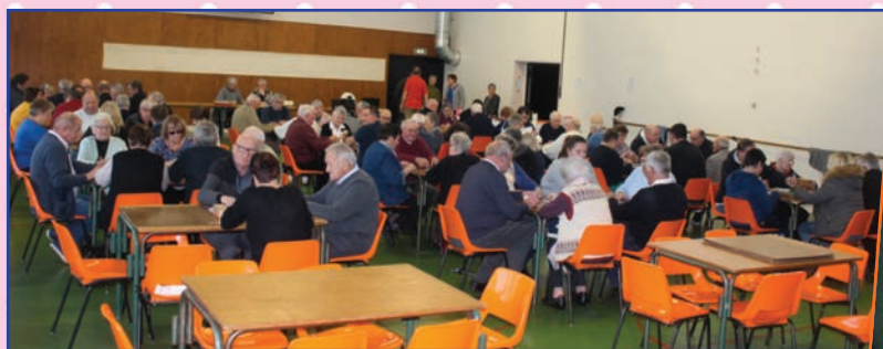
Concours de dominos