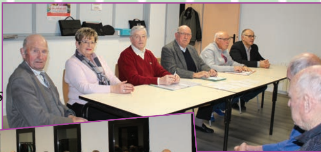
Assemblée générale des Anciens Combattants