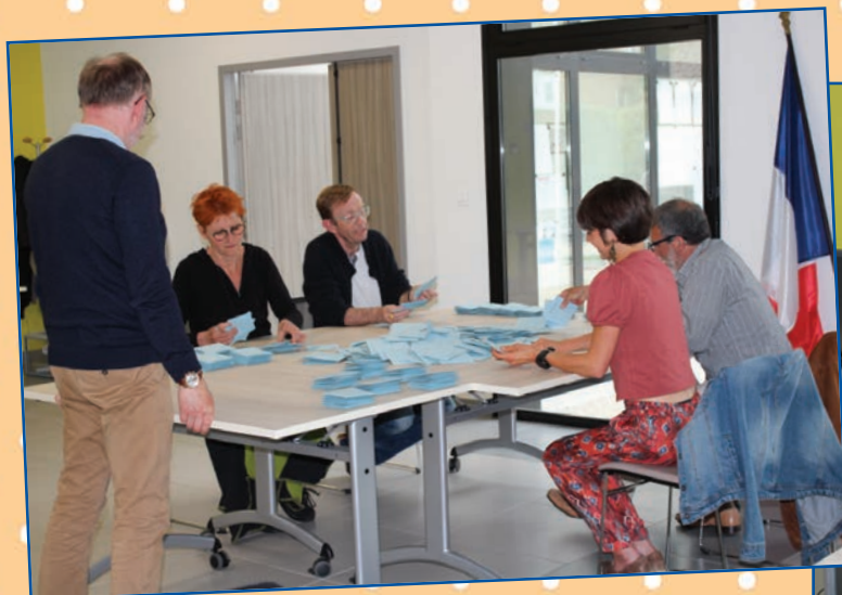
Élections européennes dans la nouvelle mairie.