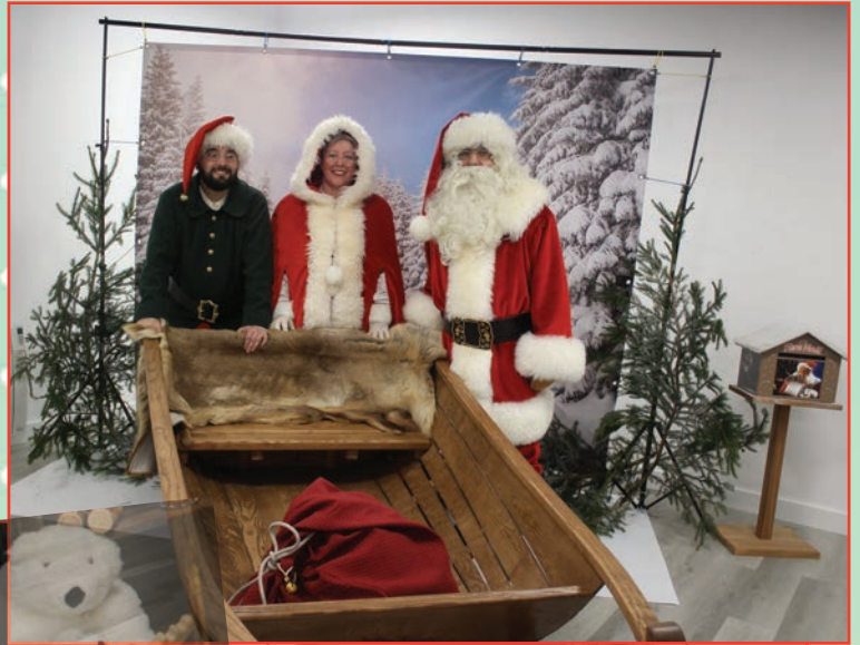
Père Noël et Mère Noël et leur traîneau