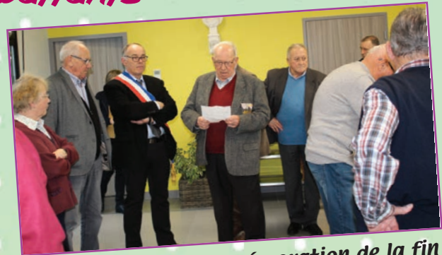
Commémoration de la fin de la guerre d'Algérie