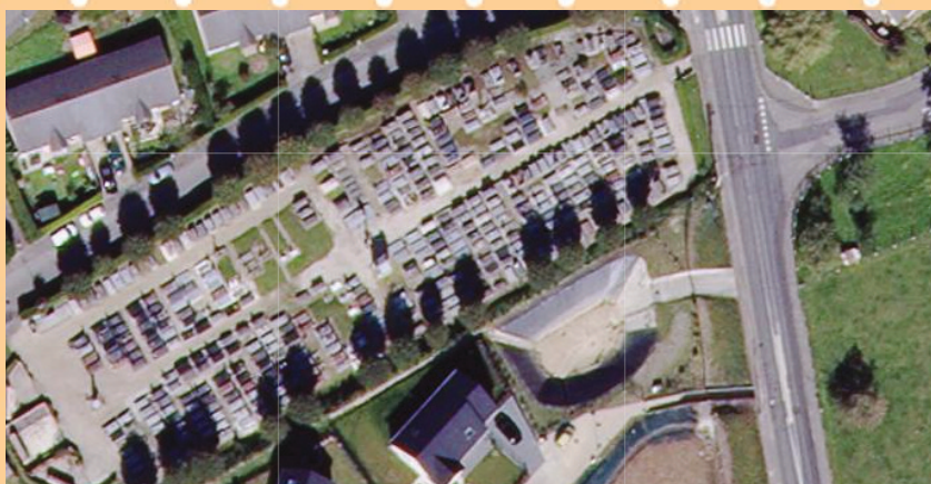
Vue aérienne du cimetière de Rolleville

tions liées au cimetière dont nous avons connaissance sur un logiciel informatique spécifique. Le travail arrive à sa fin, la prochaine équipe municipale aura une vision précise de l'état du cimetière et pourra prendre les décisions qui s'imposent pour en assurer son avenir. Je profite de cet article pour le remercier très sincèrement pour le travail long, fastidieux et ô combien délicat qu'il a mené pendant de nombreuses semaines.