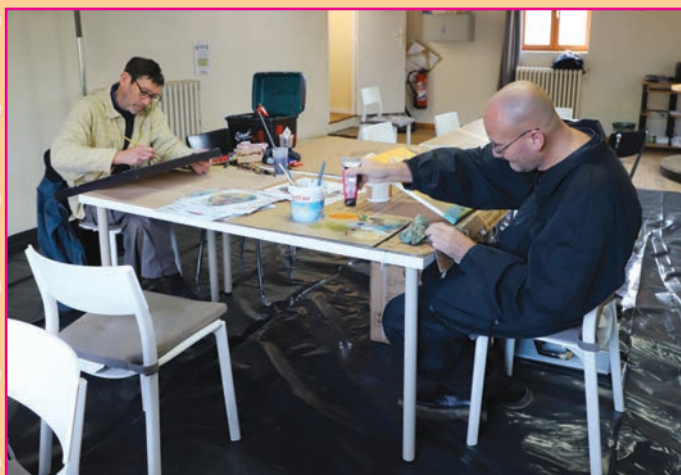
Des artistes allemands à Rolleville