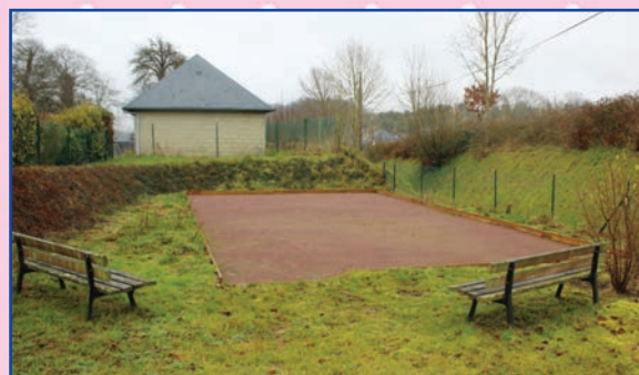
Le terrain de pétanque

Comme promis, il a été créé au lotissement des pommiers (élus et bénévoles ont œuvré sur ce chantier).