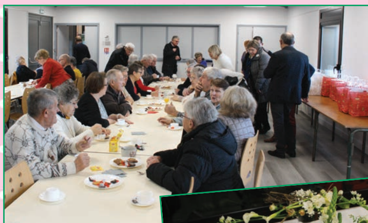
Remise des colis aux aînés