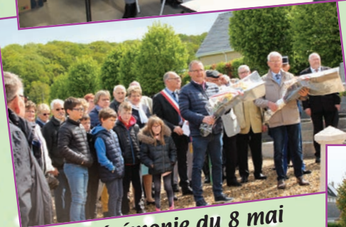
Cérémonie du 8 mai