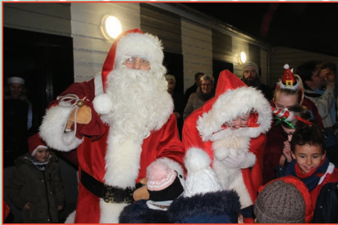
Arrivée du Père et de la Mère Noël