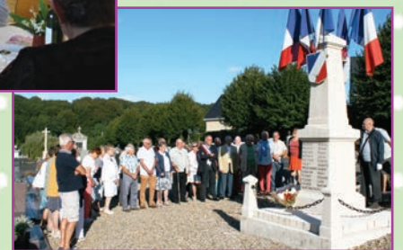
Cérémonie de la libération de Rolleville