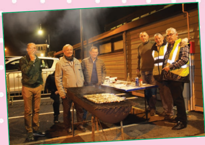
La cuisson des harengs