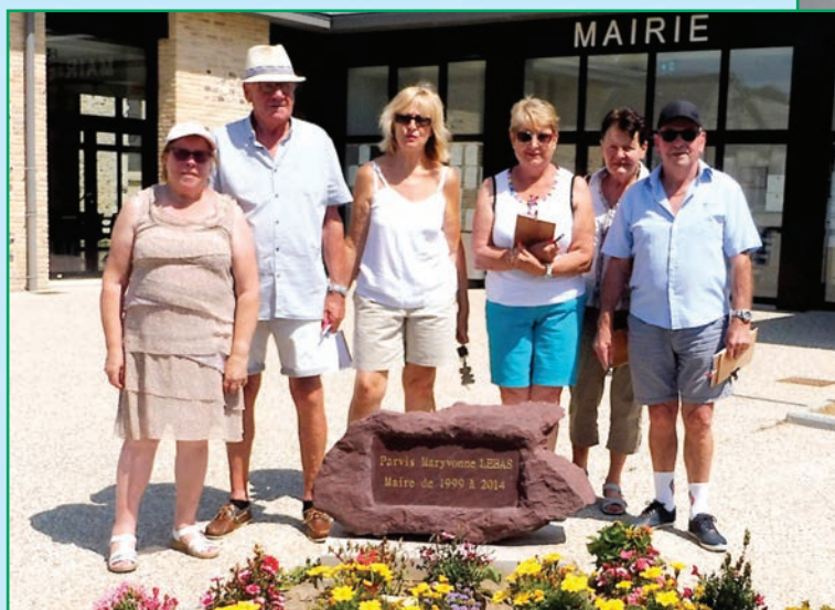
Le jury des jardins fleuris