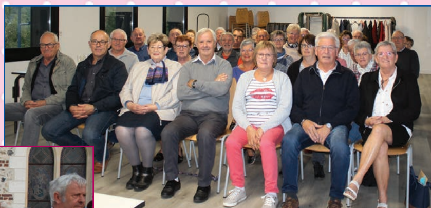
Assemblée Générale du Comité des Fêtes