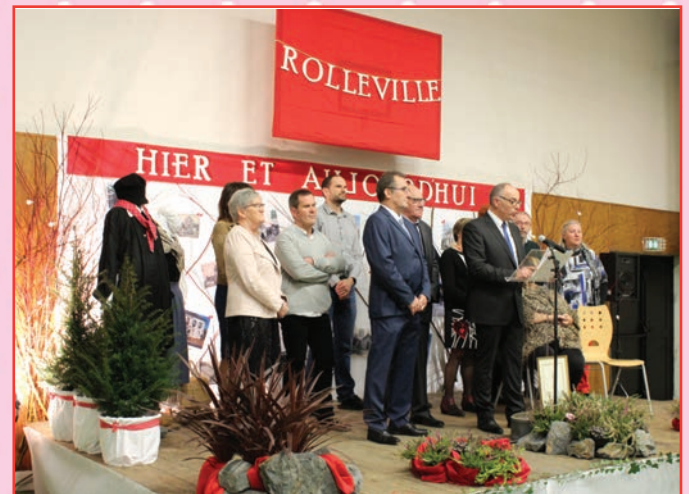
Cérémonie des vœux 2019