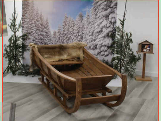
Traîneau du Père Noël