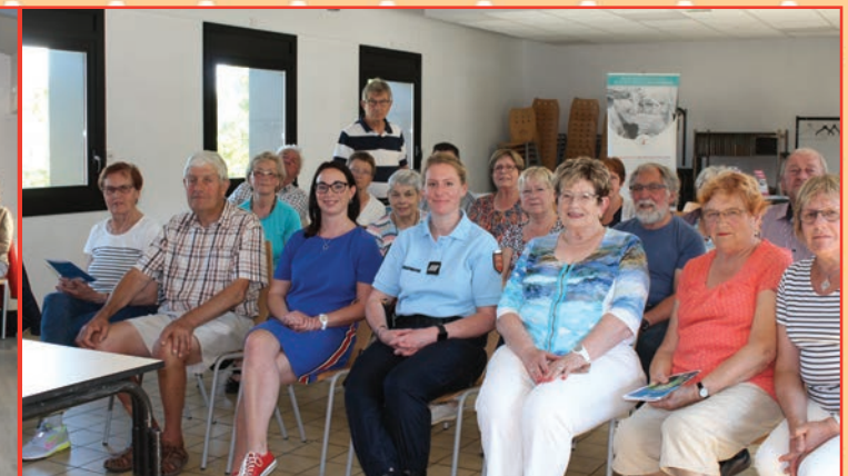
Tranquillité seniors avec la gendarmerie