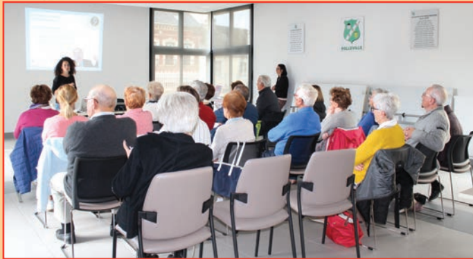
Café de l'audition