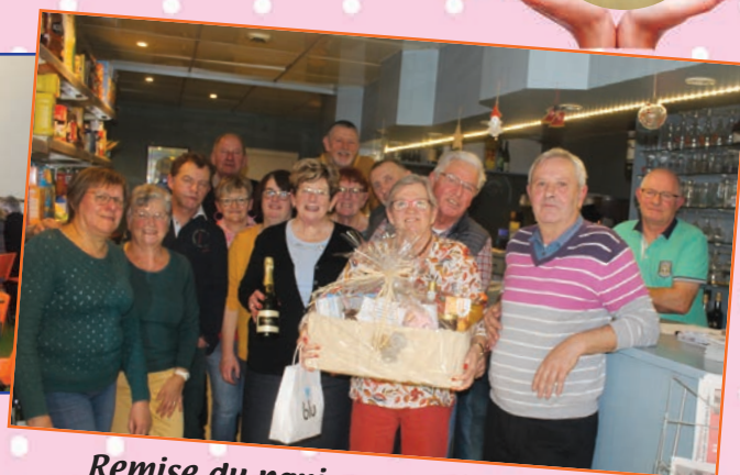
Remise du panier garni du Téléthon