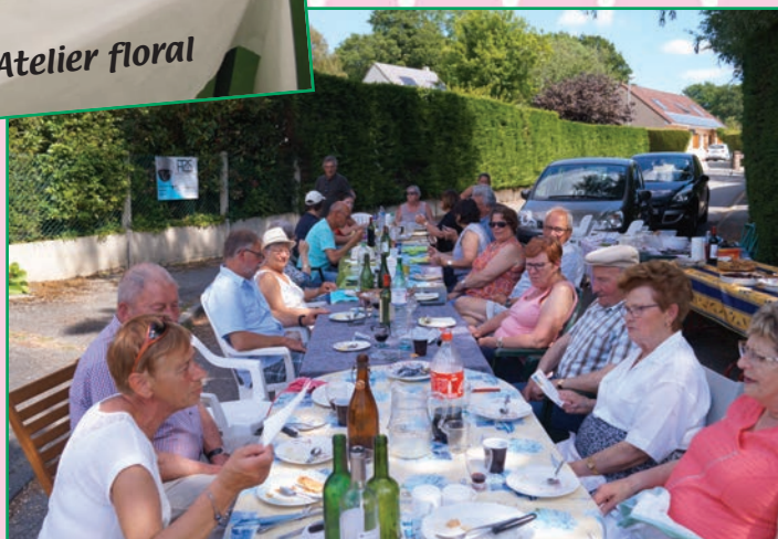
Fête des voisins aux Châtaigniers