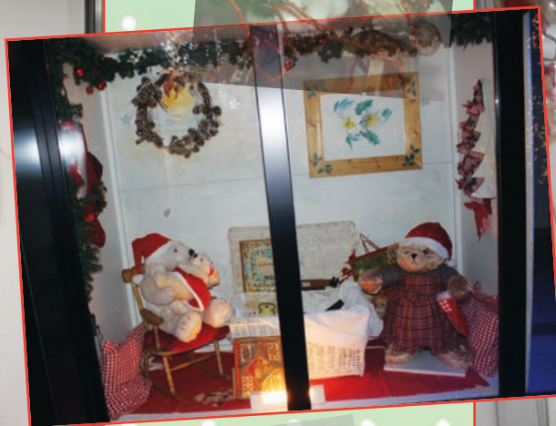
Vitrines animées à la Mairie