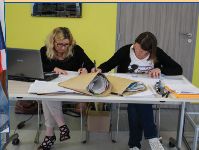
Nos secrétaires de mairie lors du dépouillement