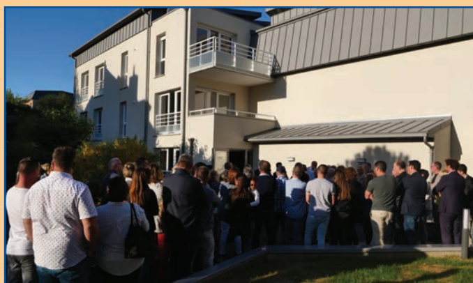
Inauguration de la résidence Maréchal Ferrant