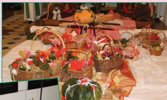
Paniers réalisés pour la fête de la moisson