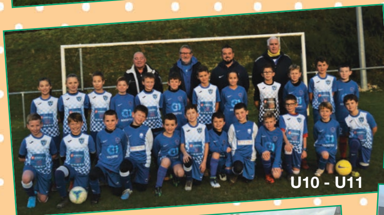
U10 - U11