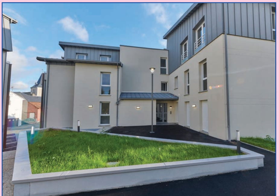
Résidence du Maréchal Ferrant