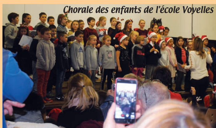
Chorale des enfants de l'école Voyelles