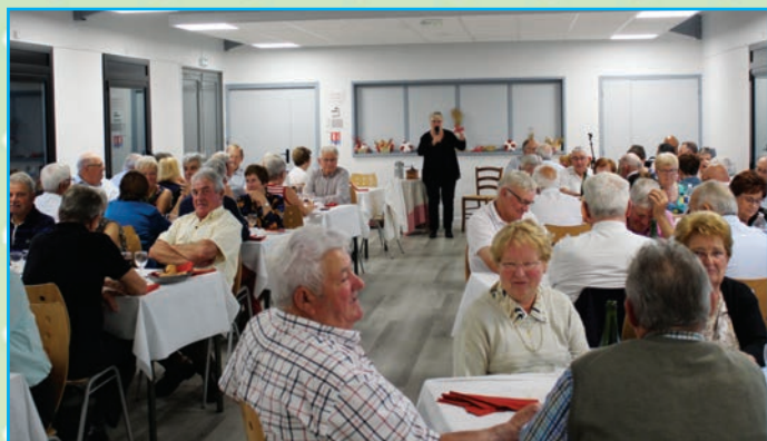
Repas des Anciens offert par le Comité des Fêtes

PH : Président Honneur - P : Président - VP : Vice-Président - S : Secrétaire - SA : Secrétaire Adjoint - T : Trésorier - TA : Trésorier Adjoint Toutes les associations rollevillaises ont été contactées pour fournir leur rapport d'activités et la composition de leur bureau.