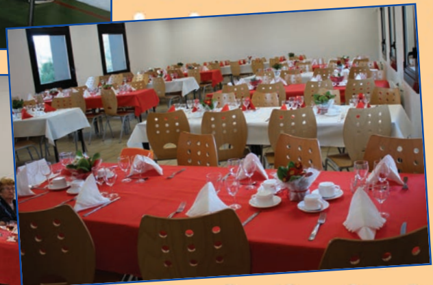
Repas des anciens offert par le CCAS