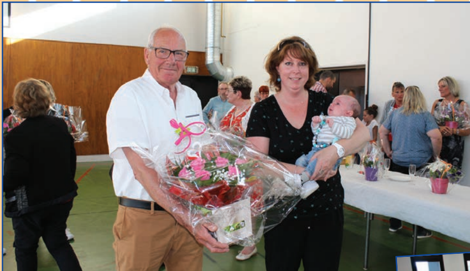
Réception fête des mères