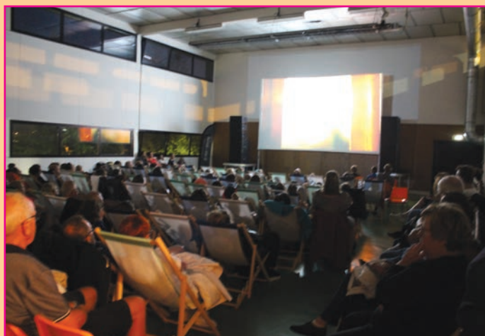
Ciné toiles au gymnase