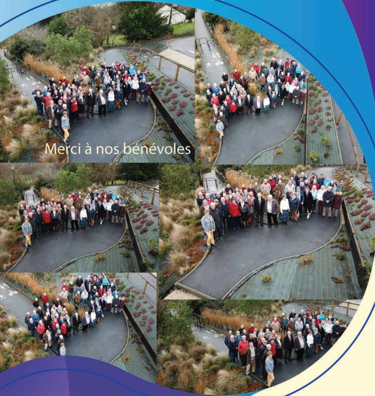
Merci à nos bénévoles