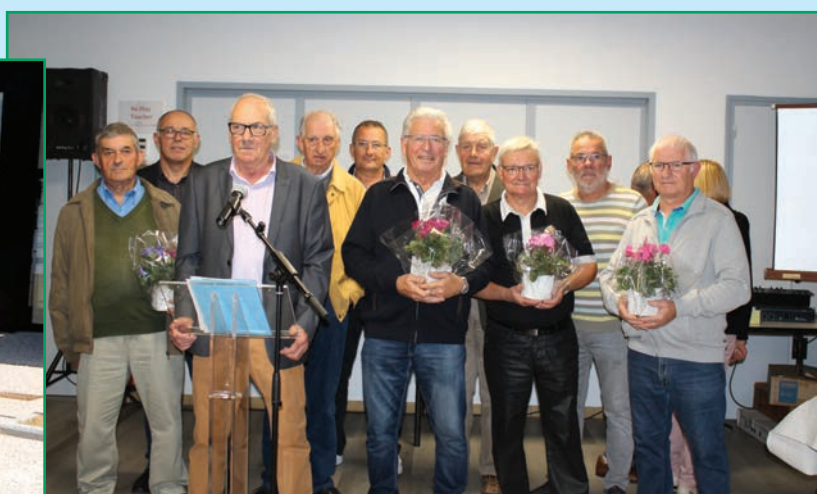
Equipe de bénévoles pour le fleurissement de la commune