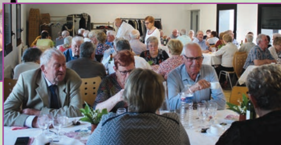
Repas du 8 mai