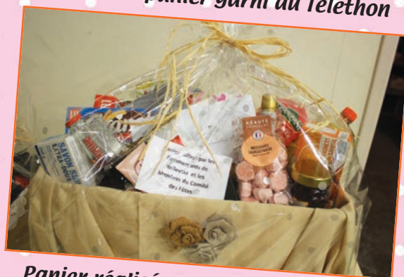
Panier réalisé par les commerçants et les membres du comité des fêtes