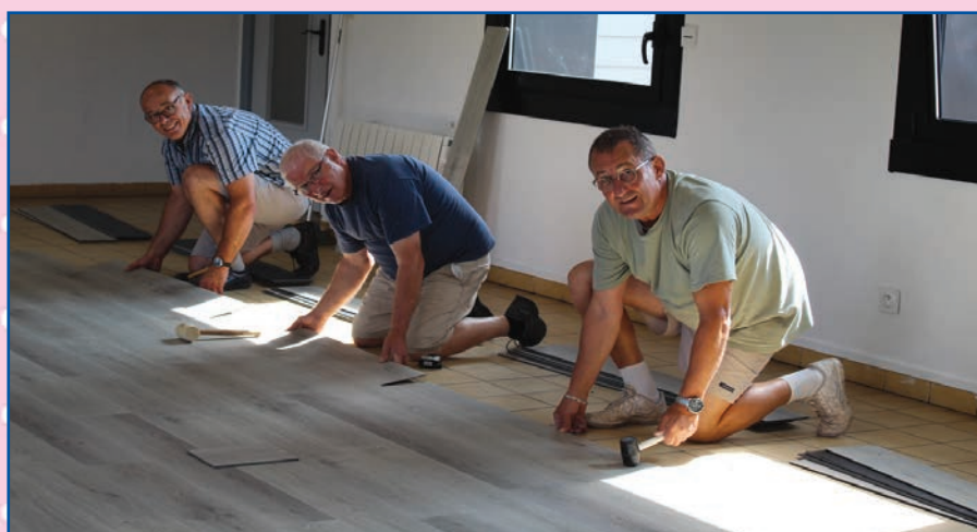
Pose du parquet dans la salle polyvalente