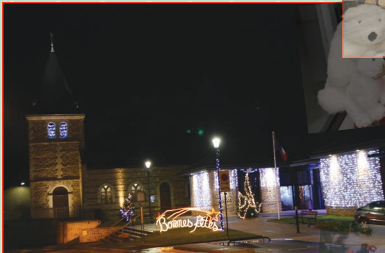
Décorations de Noël de l'entrée du village